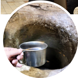
Muinaisen Samarian kaupungin Sikemin lähellä on Jaakobin ikivanha kaivo, josta edelleen saa raikasta lähdevettä.