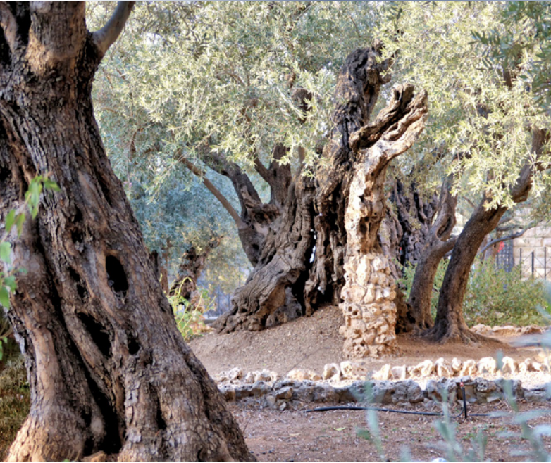
Getsemanen puutarhan jatkut oliivipuut ovat n. 2000 v. vanhoja

pidätettiin. Hiukan sivummalla on ns. puutarhahauta ja Golgatakin löytyy lähimaastosta. Vaikka täysin tarkkoja paikkoja ei enää voi tietää, konkreettiset löydöksen puhuvat selvää kieltä, täällä se kaikki tapahtui. Kun sain pidellä temppelevuoren arkeologisilla kaivauksilla löytyneitä esineitä, mm vesiruukun kahvaa, tuntui kuin olisin hypännyt tuhansia vuosia ajassa taaksepäin. Sieltä on löytynyt kolikoita, koruja, patsaan osia, nauvoja, vaatteiden osia... Aiemmin löytyi juutalaisen ylipapin viitan kultainen kulkunen, josta toisessa Mooseksen kirjassa puhutaan. Matkat ympäri Israelia avaavat Raamatun niin, että se tulee sydämen ja järjen tasolla todemmaksi. Se ei ollutkaan satua.