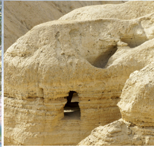
Qumranin luolista lähellä Kuollutta merta on löydetty vanhoista kääristä mm. Jesajan kirja lähes kokonaan. Radiohiilijaitoksen tekstianalyysien ja käsiala-analyysien perusteella kirjoitukset on tehty eri aikoina 100-luvun eKr. ja ensimmäisen vuosisadan välisenä aikana.