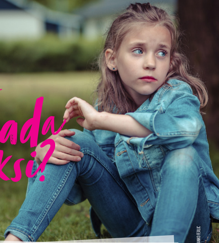
KOIVA UNISPLASH/GETTY IMAGES

Vuosia sitten kiersin kouluissa kertomassa Jeesuksesta. Esitin lapsille usein kysymyksen: "Tiedätkö miten pääsee taivaaseen?" Yleisin vastaus oli: "Olemalla kiltti." Seuraavaksi kysyin, kuinka kiltti pitää olla? Tähän lapset eivät yleensä osanneet vastata.