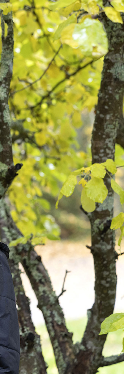
KOKO: TUULI ROPPELA