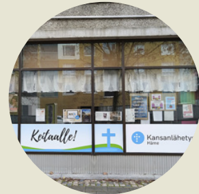
HÄMEENLINNAN KEITAALLE Kaivokatu 2