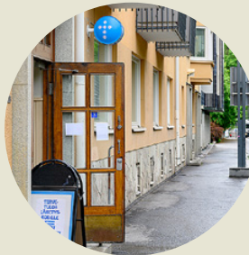
TAMPEREEN LÄHETYSKODILLE Hämeenpuisto 41

Tietoa ryhmistä ja tapahtumista toimipisteissämme sekä muualla Pirkanmaalla ja Kanta-Hämeessä löytyy kotisivuiltamme: hameenki.fi